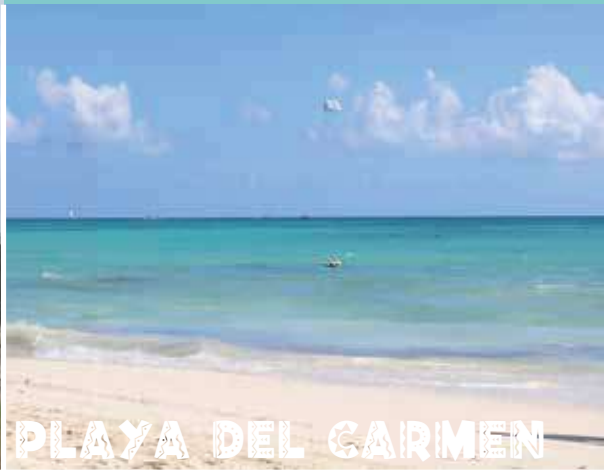
PLAYA DEL CARMEN