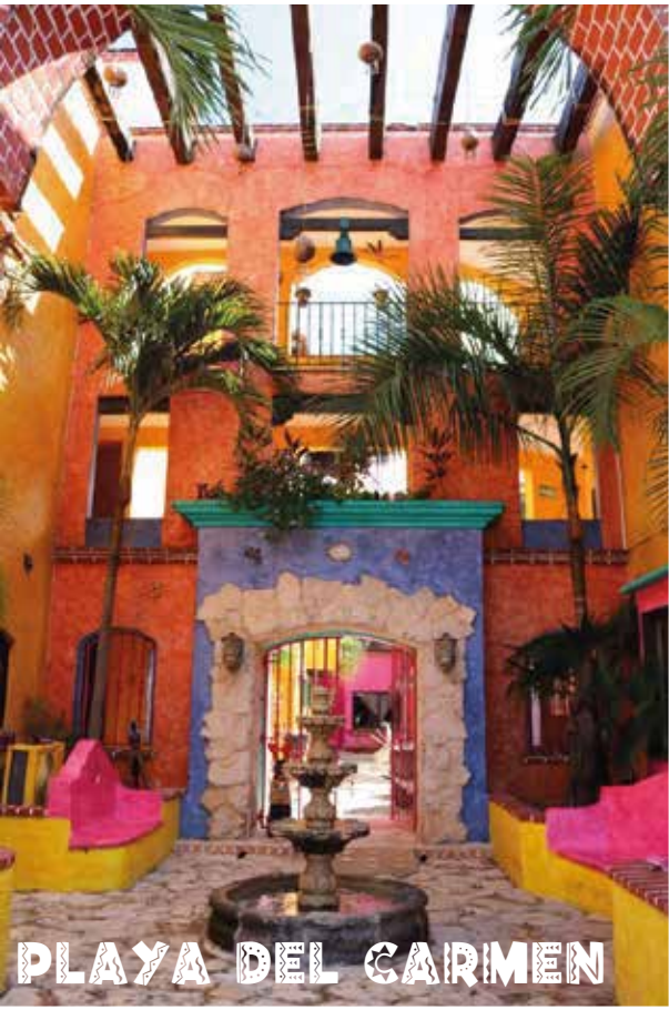
PLAYA DEL CARMEN